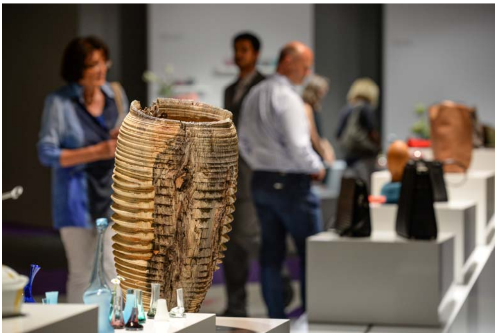
Aus dem Vorjahr: FORM 2016 – Form aus Handwerk und Industrie

Auch zur kommenden Tendance wurde der Wettbewerb „FORM – Form aus Handwerk und Industrie 2017“ ausgeschrieben. Alljährlich werden hier neue, innovativ gestaltete Produkte aus dem Gesamtangebot der Messe präsentiert. Den Teilnehmern bietet der Wettbewerb eine zusätzliche Werbung durch die Präsentation ihrer Arbeiten an einem attraktiven Ausstellungsort. Für diese vom BK in Zusammenarbeit mit der Messe Frankfurt ausgeschriebenene Veranstaltung konnten sich alle Aussteller der Tendance bewerben. Die FORM wird in der Halle 9.0, Standnummer: 9.0 E90 platziert sein, hier wird sich auch der Informationsstand des BK befinden.