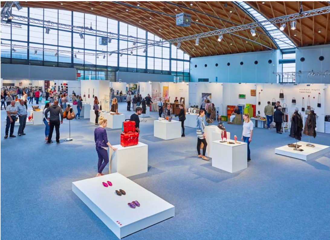
Teilansicht der Ausstellung JUST LEATHER anlässlich der EUNIQUE 2017

Anlässlich der diesjährigen EUNIQUE fand auf dem Karlsruher Messegelände vom 19. bis 21. Mai 2017 (Vernissage am 18. Mai 2017) wieder die Sonderausstellung statt, die ein Material in besonderen Fokus setzt. So war es bei der Veranstaltung 2017 das Leder.