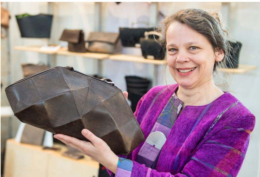
Produkt: Crystal, Umhängetasche aus Nubukleder im Vintagelook