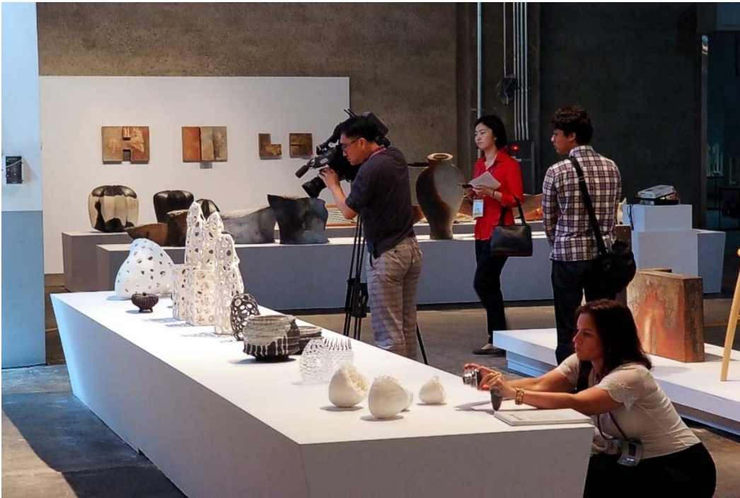
Teilansicht der deutschen Ausstellung anlässlich der Cheongju International Craft Biennale 2013 in Cheongju/Südkorea

Mehr Informationen über die Cheongju International Craft Biennale (2015) sind auf der Internetseite verfügbar: http://www.cheongjubienale.or.kr/wp/?lang=eng .