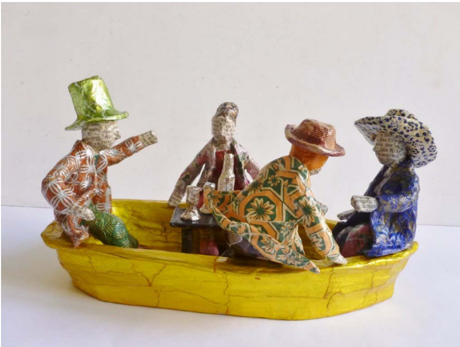
„Bootsgesellschaft“ von Heike Roesner