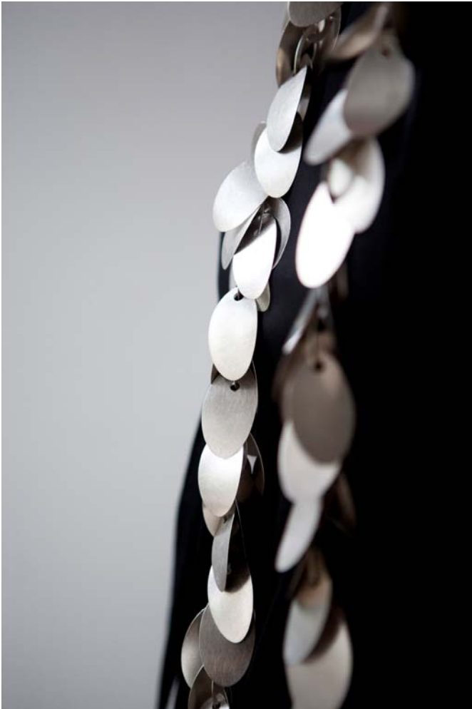
Kette „Silverpolar“ von Annette Lechler, die in der deutschen Ausstellung anlässlich der Cheongju International Craft Biennale 2013 in Cheongju/Südkorea zu sehen sein wird

Mehr Informationen über die Cheongju International Craft Biennale (2015) sind auf der Internetseite verfügbar: http://www.cheongjubiennale.or.kr/wp/?lang=eng .