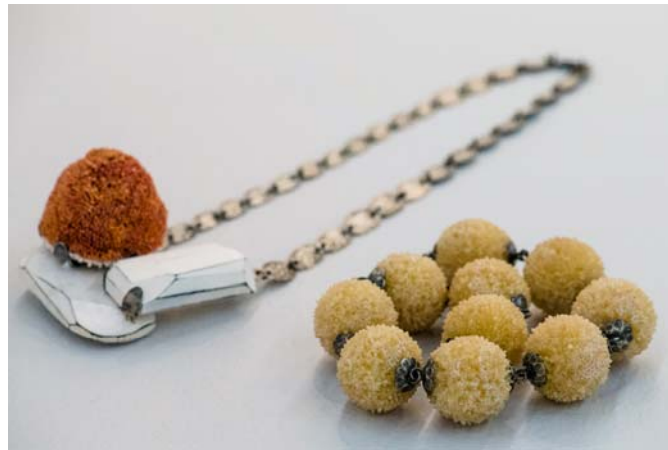
Schmuck von Mareike Beer (links) und Saerom Kong (rechts)