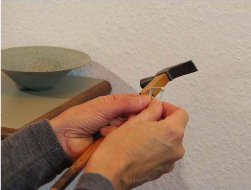
Gisela Kulling bei der Herstellung eines Ringes