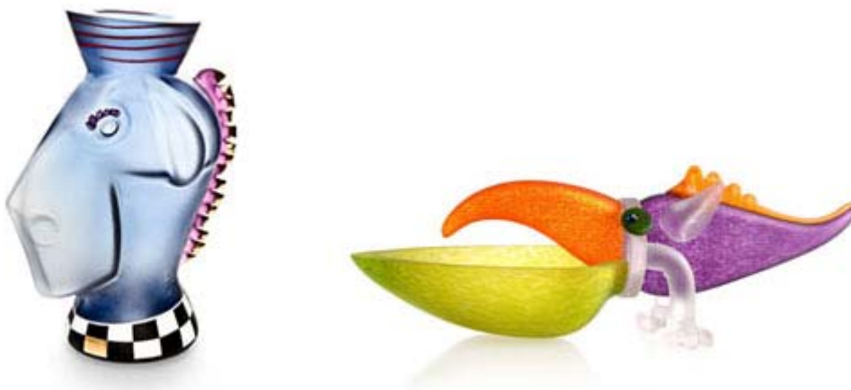
Arbeiten unseres Mitglieds Glasstudio Borowski GmbH, das seine Produkte in der Sonderschau „German Crafts“ im August 2010 anlässlich der International Gift Fair in New York präsentieren wird.

Grund dafür ist vor allem eine Besucherbefragung, die der Veranstalter im vergangenen Jahr durchgeführt hat. Das Hauptinteresse der amerikanischen Besucher dieser Messe liegt demnach im Bereich „Handmade“ und dort bei den „Designer Makers“. Wenn jetzt zur New York International Gift Fair im August 2010 eine neue, attraktive Halle in Betrieb genommen wird, kommt dieser Bereich in die neue Halle. Die deutschen Kunsthandwerker erhalten zudem eine besonders exponierte Platzierung. Der Gemeinschaftsstand wird in dem Verbindungsteil zwischen dem bisherigen Messegelände und der neuen Halle platziert. Wir freuen uns über diesen Umzug, denn wir gehen davon aus, dass für die Kunsthandwerker aus Deutschland damit eine wirtschaftliche Aufwärtsentwicklung auf der Messe in NYC verbunden ist.