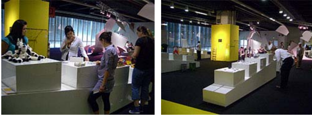
Die Ausstellung „FORM 2009 – Form aus Handwerk und Industrie“ in der Halle 6.1