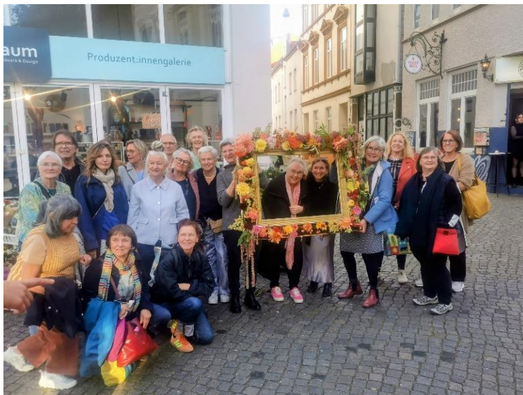
Mitglieder bei unserem Treffen im vergangenen Jahr in Bremen vor der Produzent*innen Galerie RAUM

Mitgliederversammlungen sind immer eine gute Gelegenheit zum persönlichen Austausch, zum Wiedersehen und für neue Impulse – verbunden mit Werkstattbesuchen bei Kolleginnen und Kollegen. Weitere Informationen zum Programm und den Veranstaltungsorten folgen rechtzeitig. Wir freuen uns schon heute darauf, Sie in Lübeck begrüßen zu dürfen!